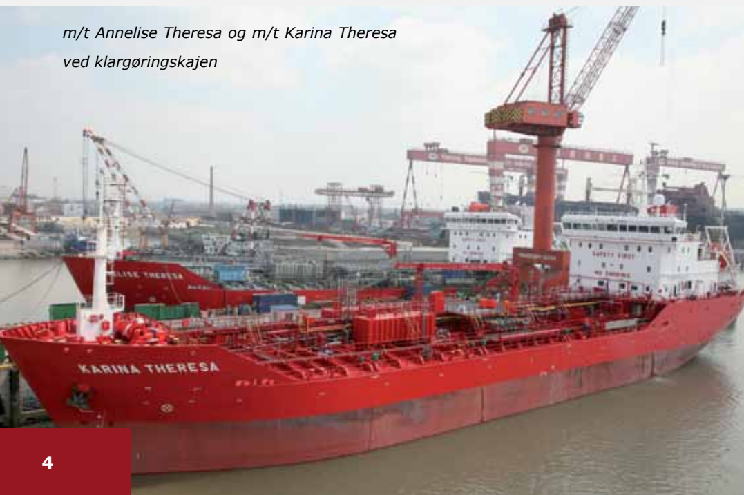
m/t Annelise Theresa og m/t Karina Theresa ved klargøringskajen