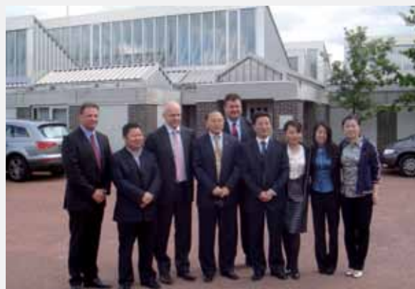
Ledelsen fra Nantong Mingde Shipyard og China Chengdu Trading House foran herning shipping

kontor i Herning som et besøg i København, hvor gæsterne aflagde visit i Danmarks Rederiforening med deltagelse fra den kinesiske ambassade i Danmark.